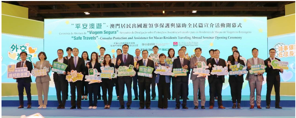
“平安澳遊” — 澳門居民出國遊領事保護與協助全民篇宣介活動啟動禮合照