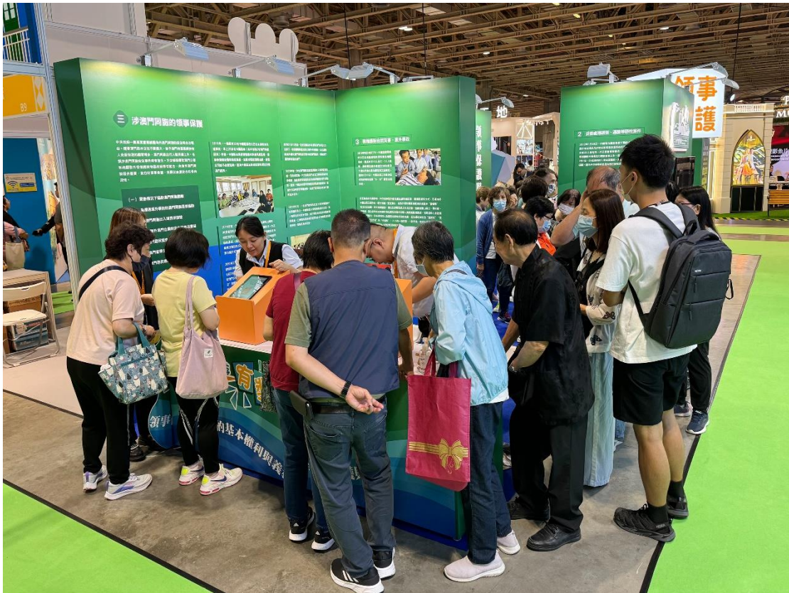
市民踴躍參與展位遊戲